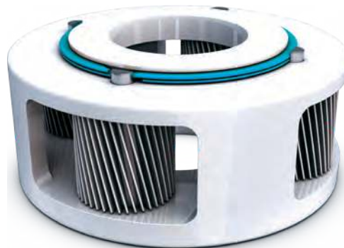
Gear Assembly Application